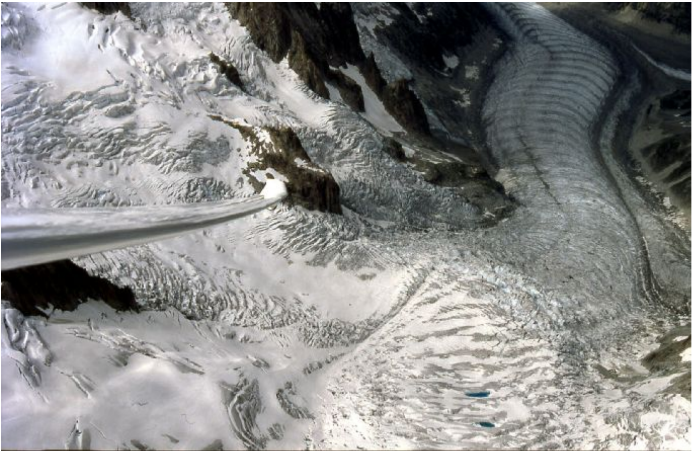
über den Gletschern am Mt. Blanc