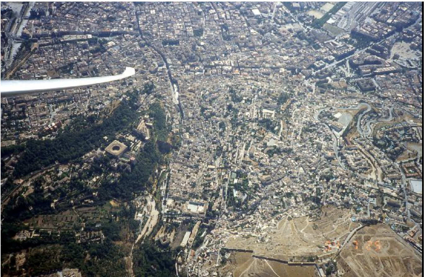
Über Granada ... unter der Flügelspitze der Al Hambra Pallast