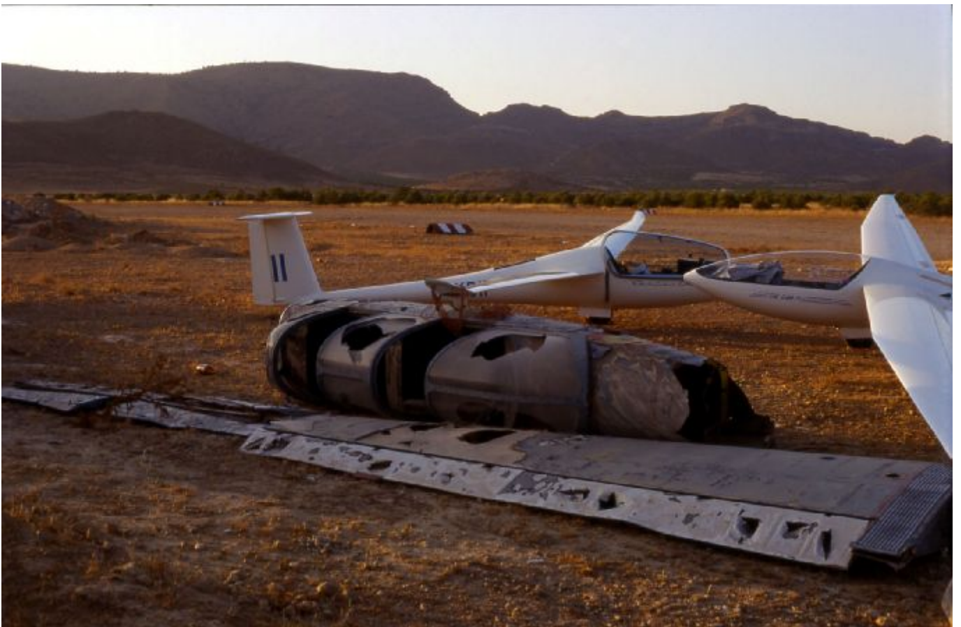
neu und alt in Ontur Spanien