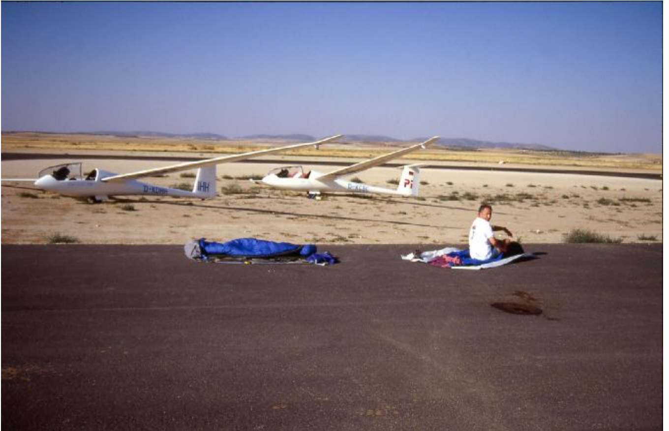
Räumung unseres Nachtlagers in Lillo Spanien