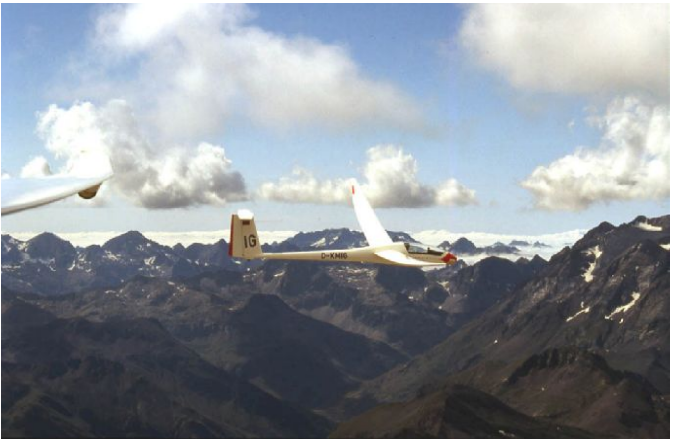
Udo mit Nimbus 3T IG in den Pyrenäen