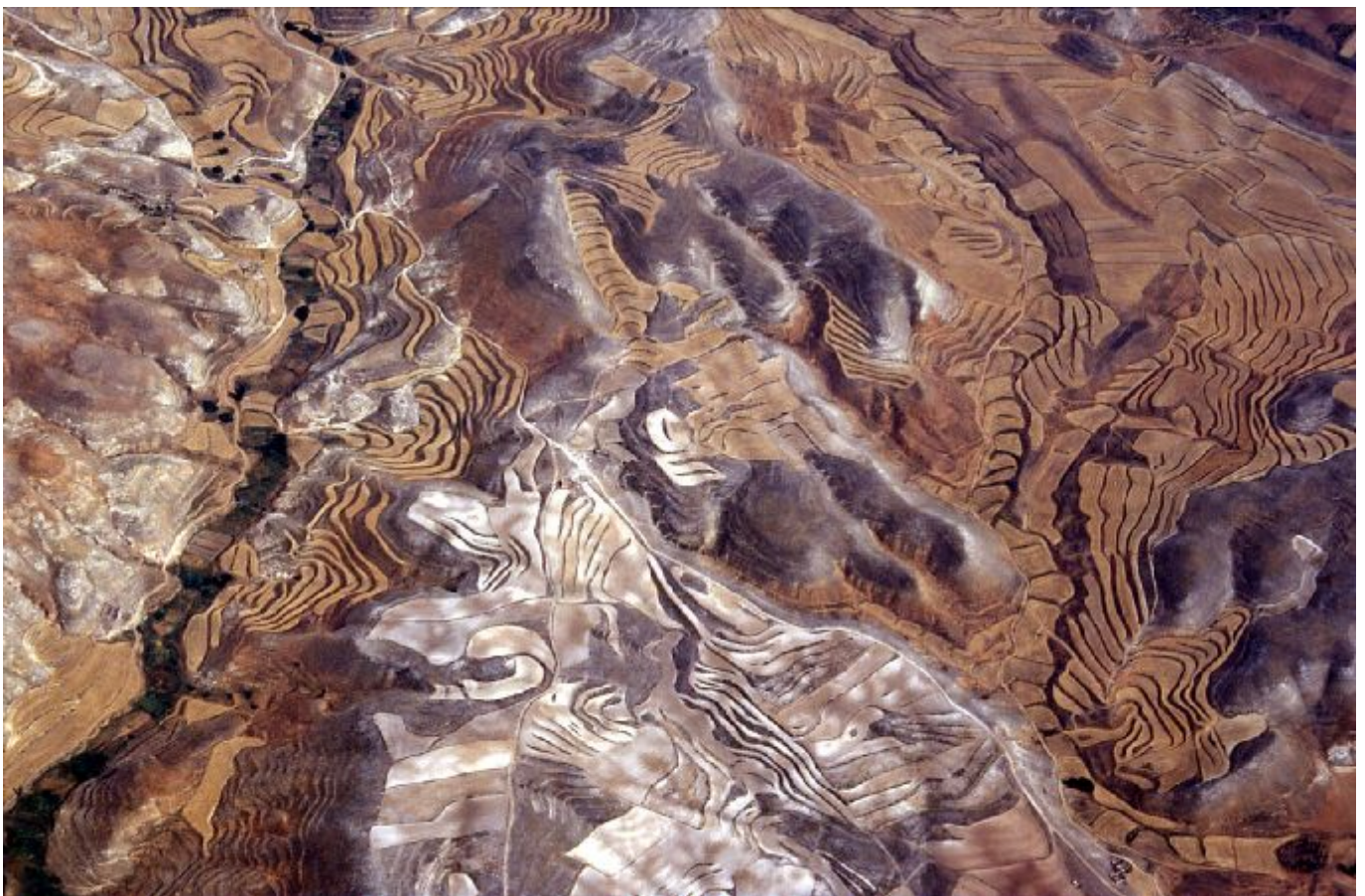
Landschaft bei Cuenka