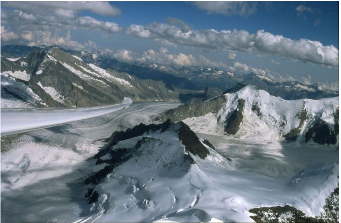
Der Aletsch Gletscher mal von der anderen Seite