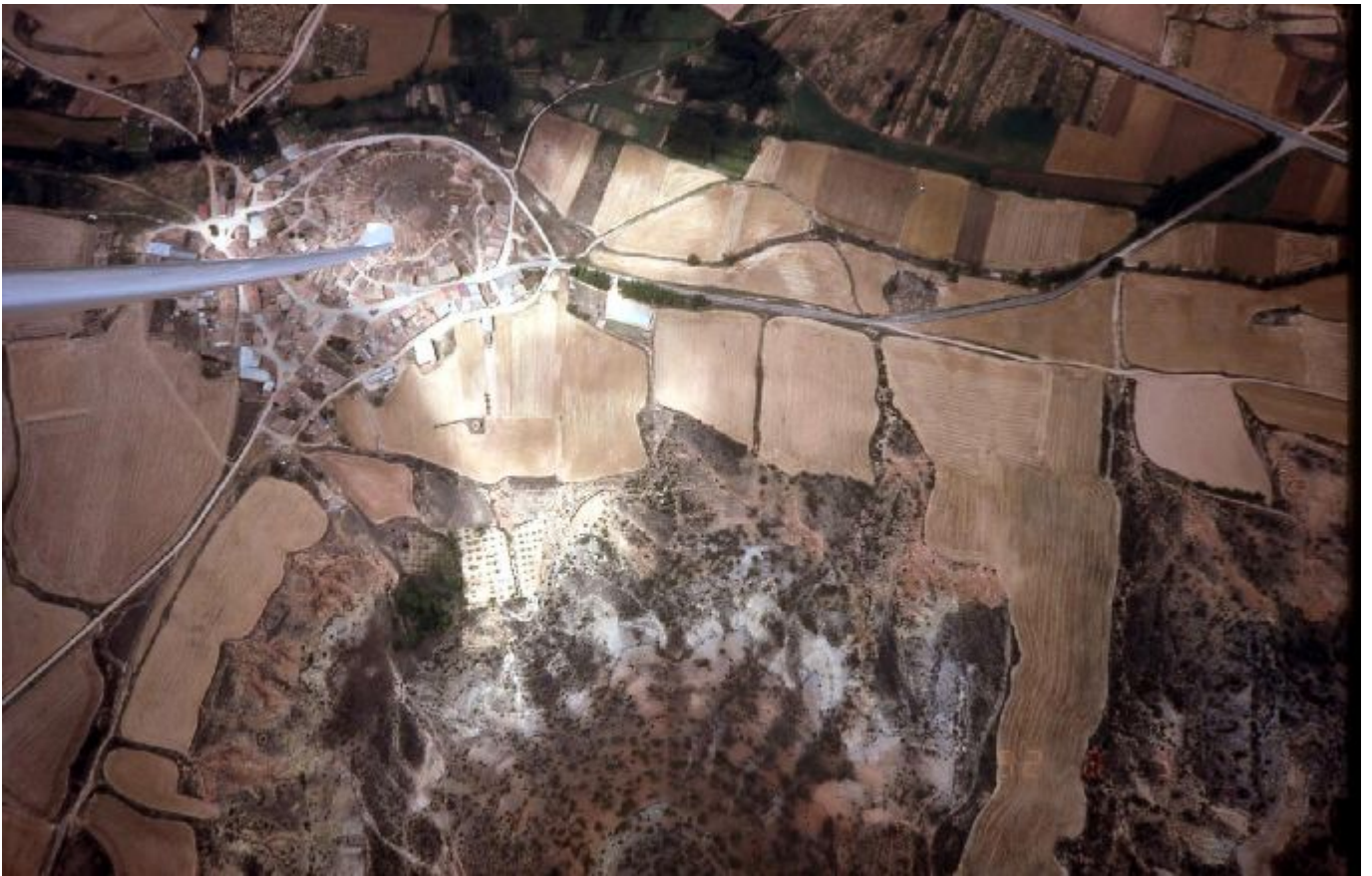
Berge die aussehen wie Quallen... bei Soria Spanien