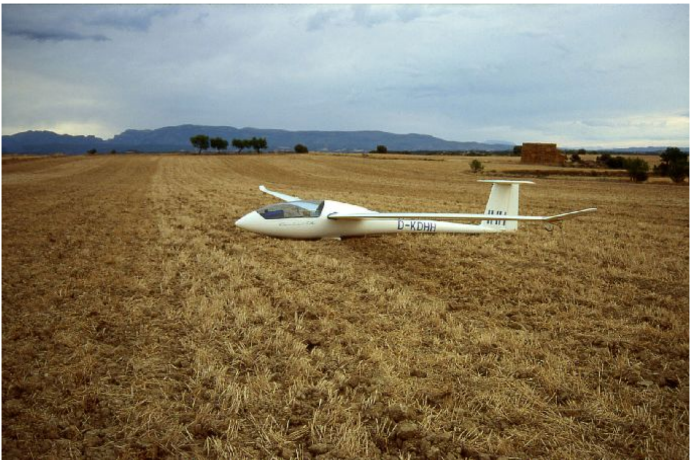
Außenlandung bei Huesca... eine Gruppe aus Frankreich hat mich abgeholt