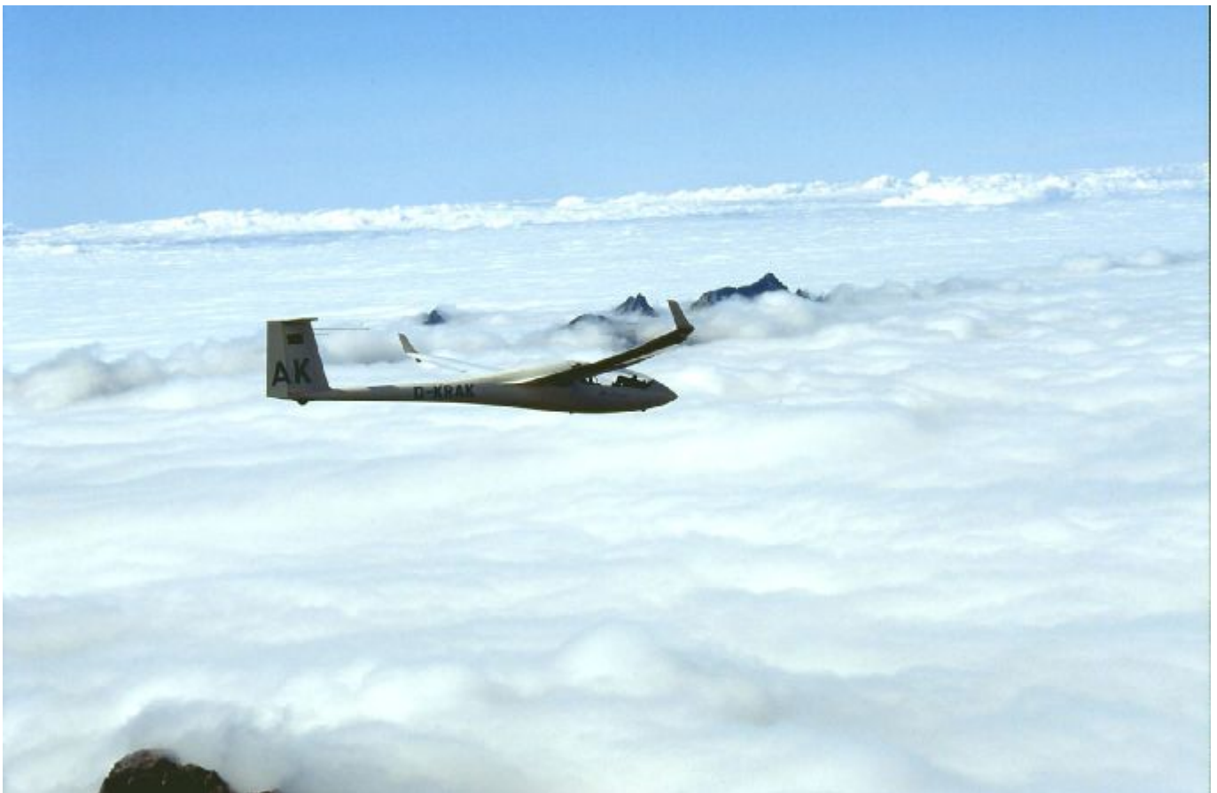
Abi am Hauptkamm der angestauten Pyrenäen