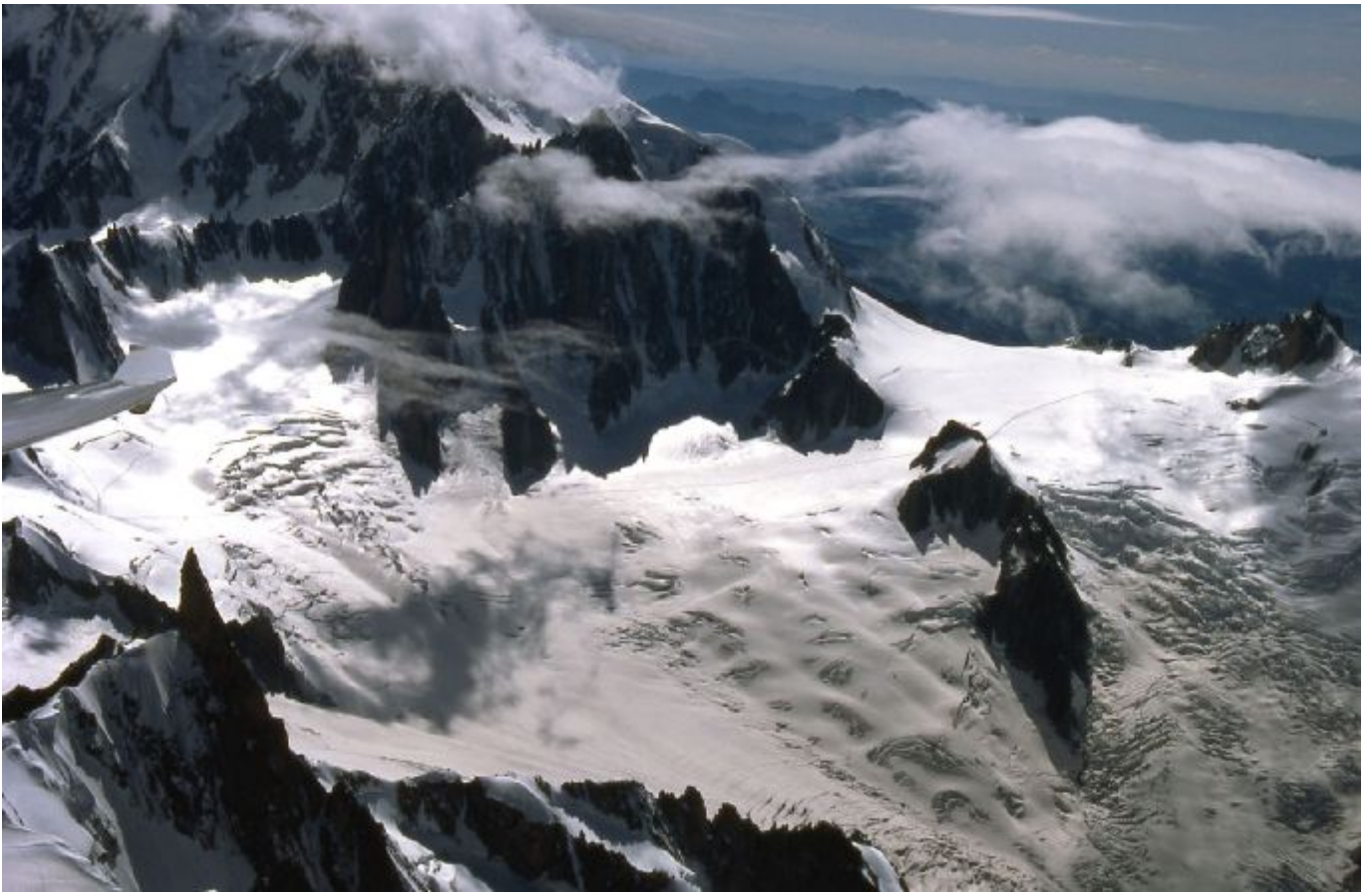
Am Mt. Blanc